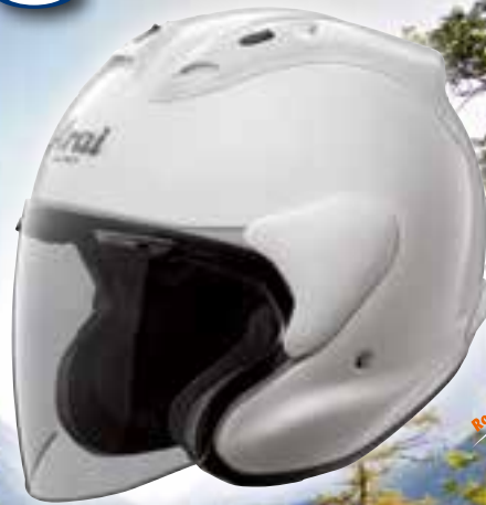
X-TEND RAM Blanco

El casco abierto X-Tend RAM ofrece más detalles: más protección, más confort y más ventilación regulable. Y además, incluso mejor ajuste sin alterar esa sensación de libertad ni la excelente visibilidad que sólo un casco abierto puede ofrecer. La parte inferior de los laterales de la carcasa exterior del X-Tend RAM es tres centímetros más amplia para disfrutar de mayor confort y seguridad. Los nuevos soportes y un sistema de ventilación lateral cubierto completan el bonito diseño de este magnífico casco de touring.